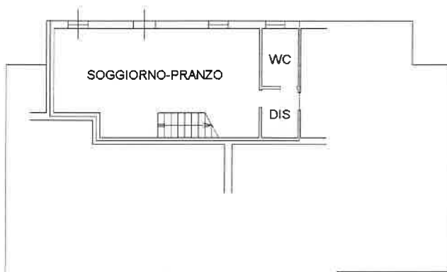
PIANO TERRA H=270